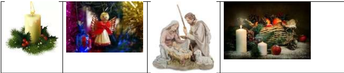
А) Новый год